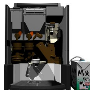
Version Espresso avec Cappuccino*

*Toutes les versions ci-dessus présentées peuvent être en version grands gobelets